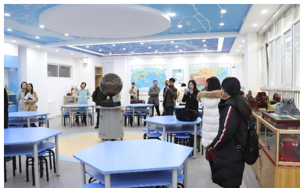
参会教师参观附属学校的地理实验室