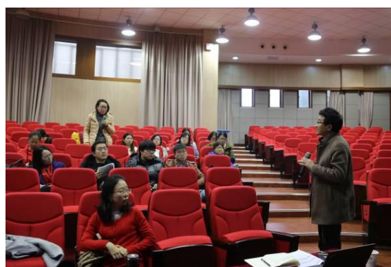
报告会交流研讨现场

研讨会于下午 16:30 结束，会议对 2017 级规培教育硕士加强科研意识、提升学术水平、营造学术氛围、推进论文进展、提高论文质量等方面都起到了积极的作用。