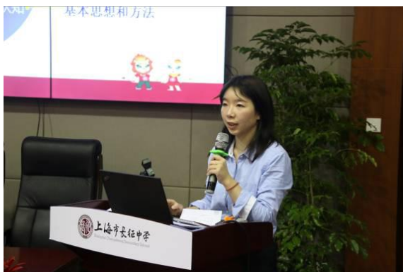
米雪做《中学生地理综合思维素养提升的实验研究》报告